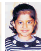
Manasvi Hisar (Haryana)