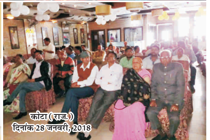
कोटा (राज.) दिनांक 28 जनवरी, 2018