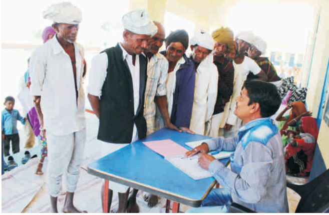
शिविर आरम्भ में पंजीकरण प्रक्रिया