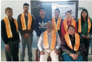
जय श्री कृष्णा, न्यू एज पब्लिक स्कूल, गुप्ता एन्क्लेव, विकास नगर, नई दिल्ली - 59