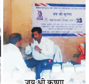
जय श्री कृष्णा