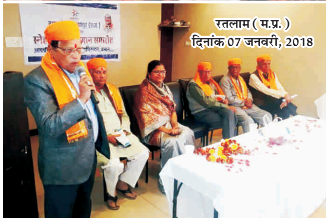
रतलाम (म.प्र.) दिनांक 07 जनवरी, 2018