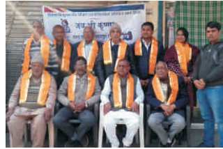
जय श्री कृष्णा बुद्ध विहार, फेस - 1, दिल्ली - 86