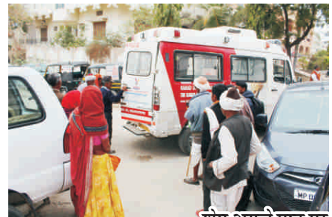
शेष अगले पृष्ठ पर

एक-एक कर बुजुर्गों को डॉक्टर सा. के पास भेजा जा रहा है। कुछ बुजुर्गों को तो आँखों में जलन-खुजली की समस्या है उन्हें डॉक्टर सा. ने देख कर दवा दे दी है। अरे ये क्या ये बासा तो बिलकुल देख नहीं पा रहे उन्हें उनका पोता हाथ पकड़ कर ला रहा है। डॉक्टर सा. ने उन्हें देखा.... ओफ इनकी आँख तो एकदम सफेद यानी बिलकुल पका हुआ मोतियाबिन्द, डॉक्टर सा. उन्हें डांटते हैं कि बिलकुल दिख नहीं रहा तो अभी तक इलाज क्यों नहीं कराया आँख फूट जाती तो, वे मासूमियत से जवाब देते हैं "तो कई नी" (मतलब तो कोई बात नहीं)