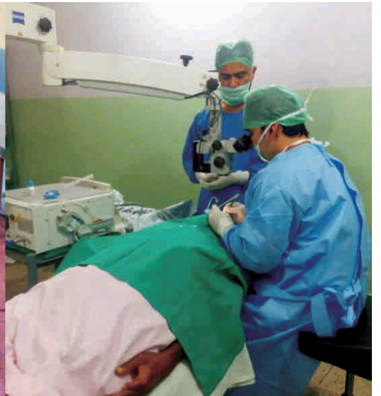
शिविर से चयनित मरीजों का मोतियाबिन्द ऑपरेशन प्रक्रिया तारा नेत्रालय में