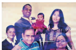
Lohiya Family Mumbai