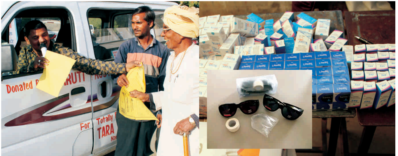
शिविर क्षेत्र में प्रचार - प्रसार