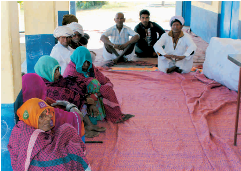
मोतियाबिन्द ऑपरेशन हेतु चयनित मरीज