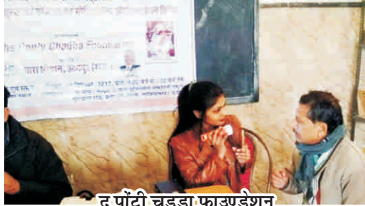
द पॉटी चड्डा फाउण्डेशन