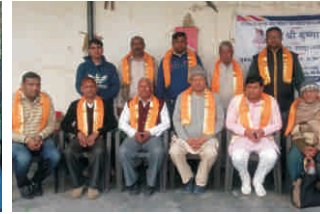
जय श्री कृष्णा टोडरमल कॉलोनी, नजफगढ़, नई दिल्ली - 43