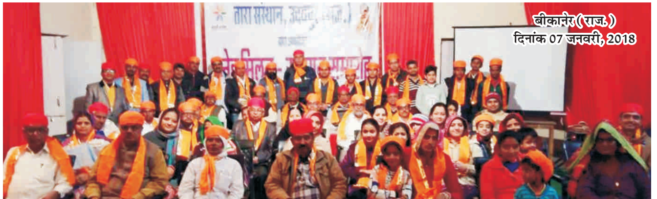
बीकानेर (राज.) दिनांक 07 जनवरी, 2018