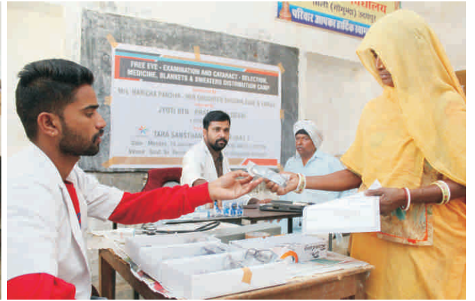
जरूरतमंदों की दवाइयों एवं चश्मों देते हुए