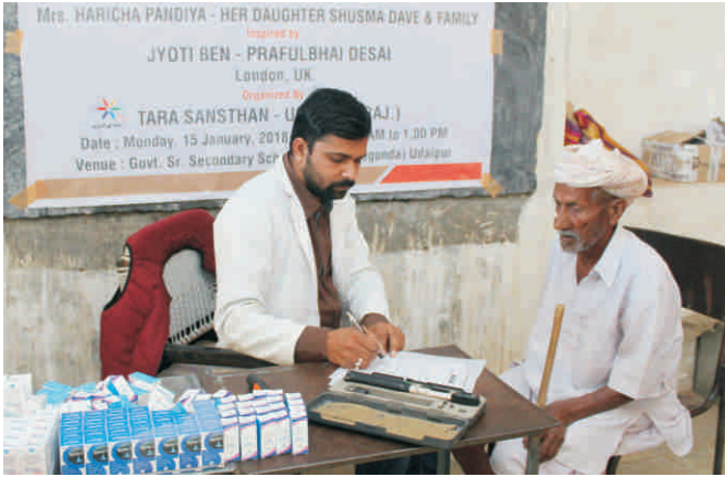
बी.पी. शुगर आदि की जाँच