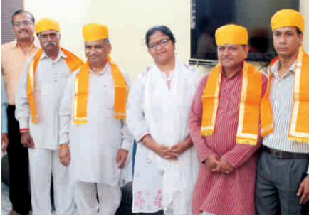
सेवा भारती, उदयपुर के साथ तारा परिवार