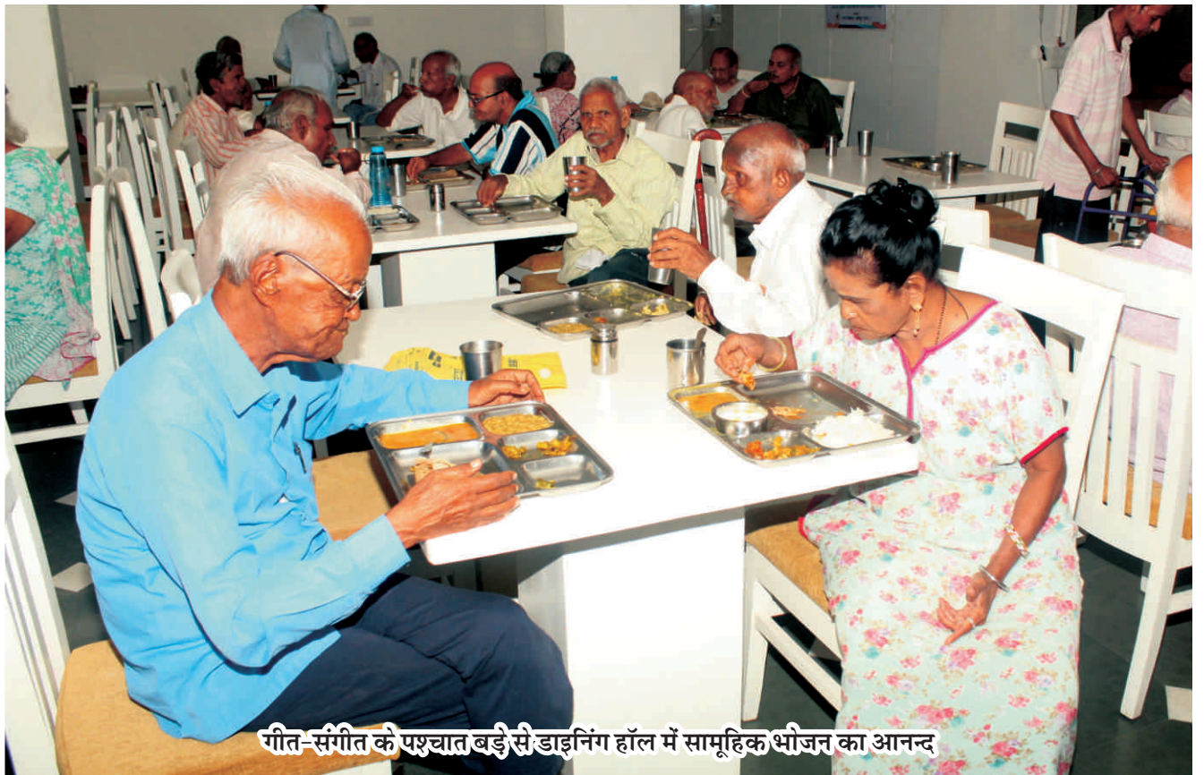
गीत-संगीत के पश्चात बड़े से डाइनिंग हॉल में सामूहिक भोजन का आनन्द