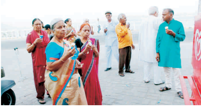
सुहावने दिन आनंद वृद्धाश्रमवासी फतेहसागर की सैर पर