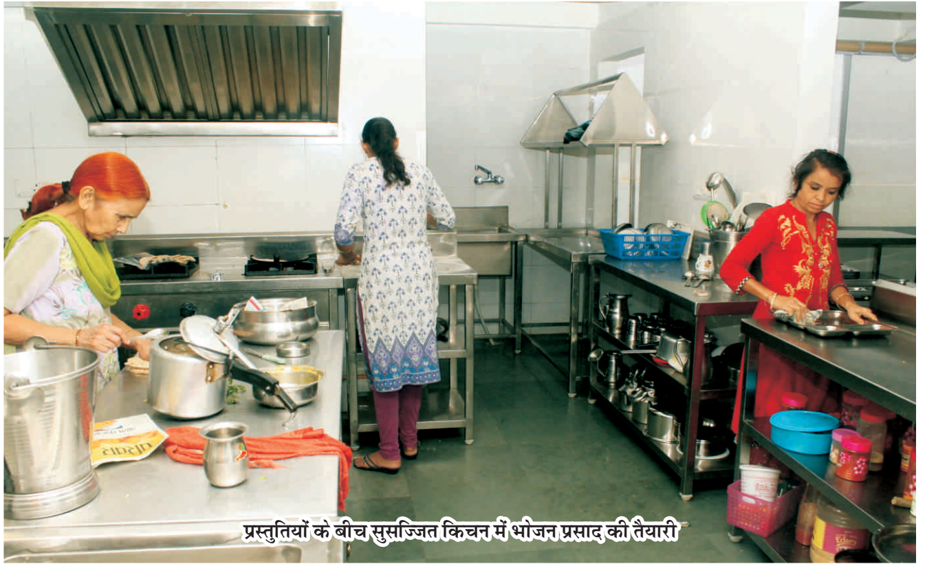
प्रस्तुतियों के बीच सुसज्जित किचन में भोजन प्रसाद की तैयारी

आनन्द वृद्धाश्रम परिसर में नवीन कार्यकलाप :