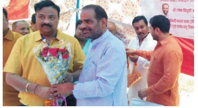
श्री रमेश बिघुडी जी ( सांसद, दक्षिणी दिल्ली ) 25.06.2018 को अग्रवाल सभा ट्रस्ट, दिल्ली में आयोजित शिविर में