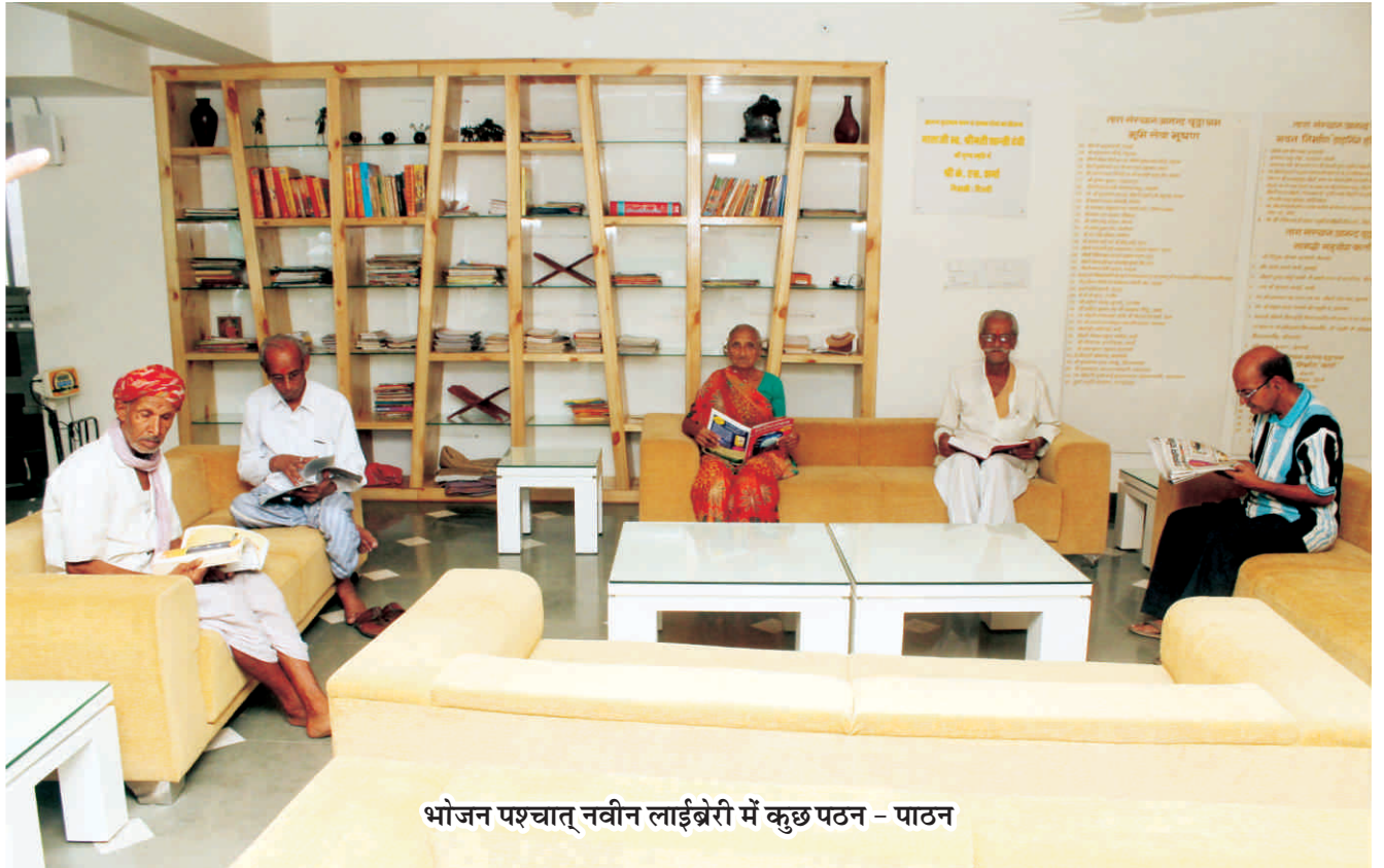
भोजन पश्चात् नवीन लाईब्रेरी में कुछ पठन - पाठन