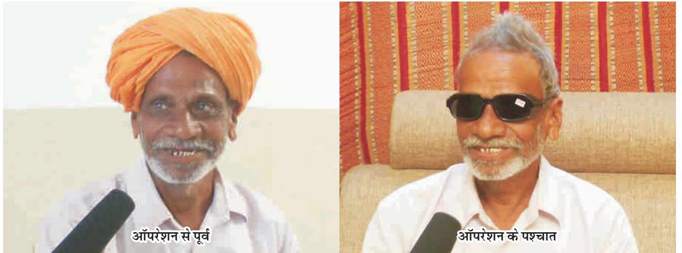
ऑपरेशन से पूर्व